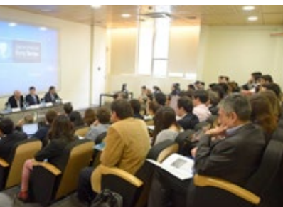
Seminario sobre el nuevo marco regulatorio para la libre competencia.