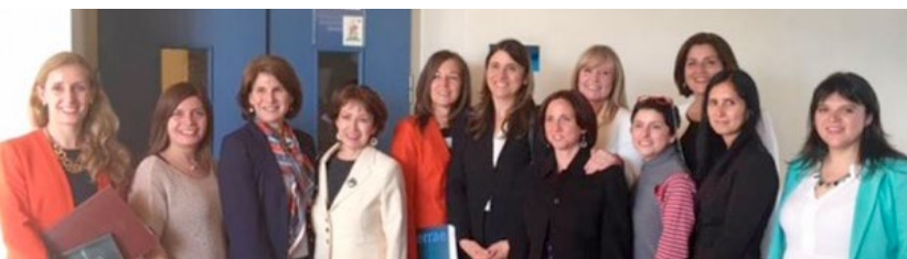
VI Seminario Profesoras de Derecho Público.