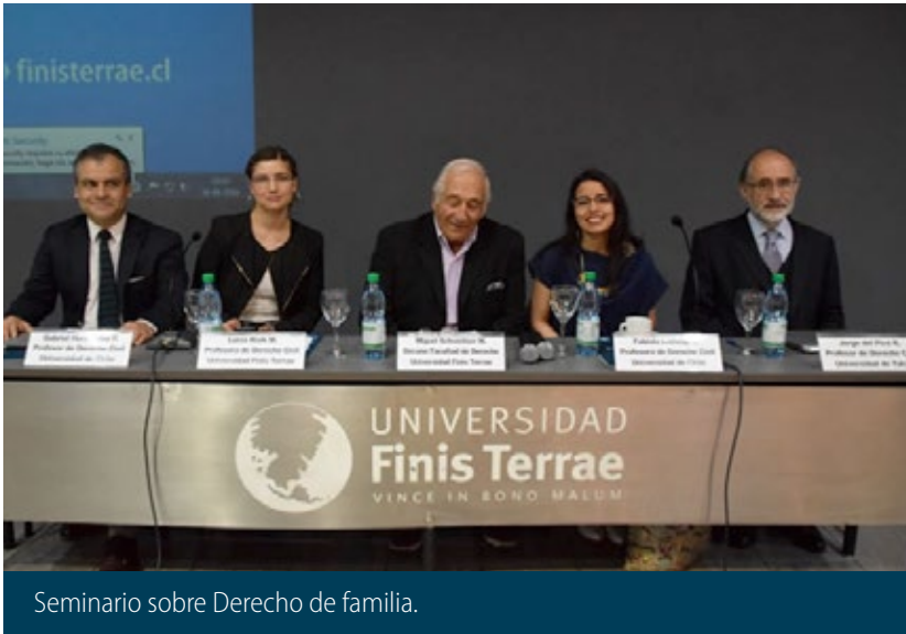
Seminario sobre Derecho de familia.

La discusión académica a través de charlas, simposios y seminarios, tuvo un lugar importante dentro de las actividades de vinculación con el medio de la Facultad.